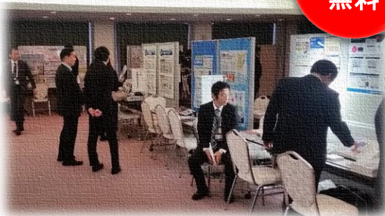
※昨年のブース展示の様子